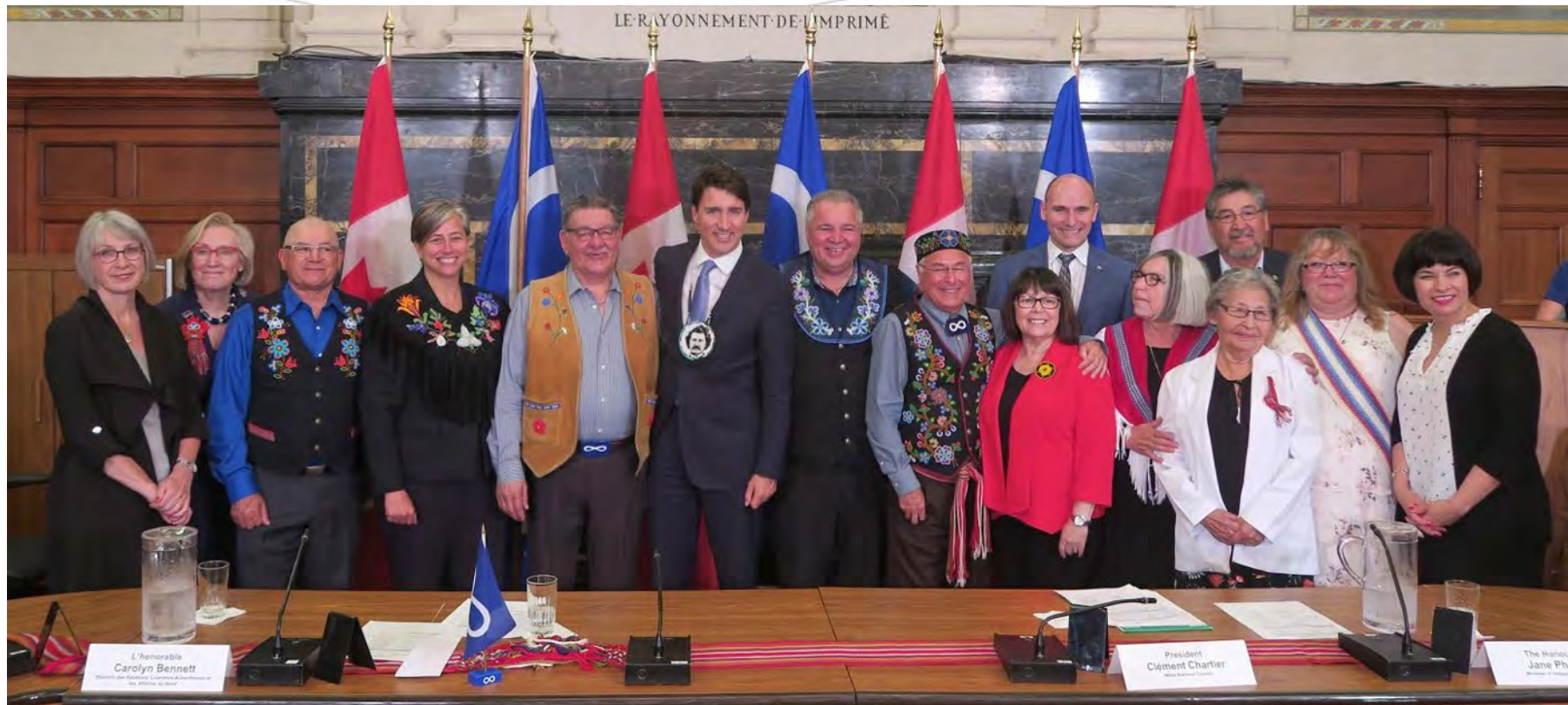
Sommet Couronne – nation des Métis, le 15 juin 2018.