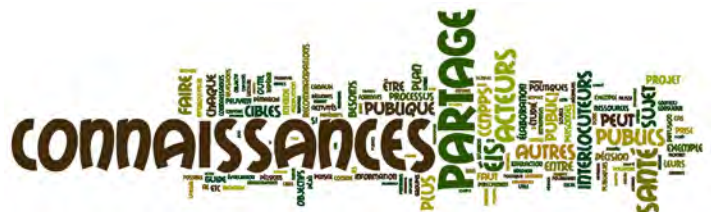
Image : générée à partir du site www.wordle.net avec le texte du CCNPPS.